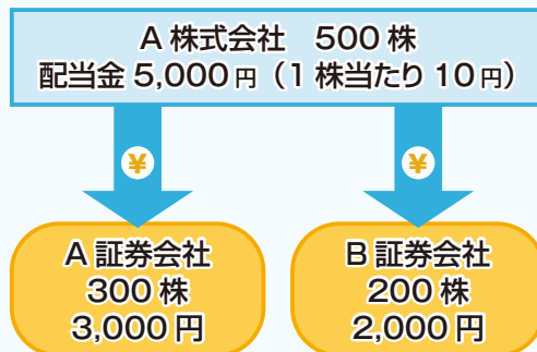
③株式数比例配分方式のイメージ

※ご所有の株式の一部が特別口座で管理されている場合などは、選択できません。 ※ご所有の株式の一部が、株式数比例配分方式の配当金受取り方法を採用していない証券会社にご預託の場合は選択できません。詳しくはお取引の証券会社にお問い合わせください。