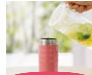
スポーツ飲料・レモネード