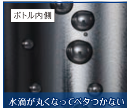
水滴が丸くなってべたつかない