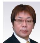
牧草 一人 先生