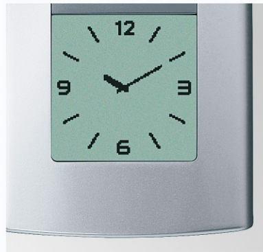
原寸大 (バックライト消灯時)