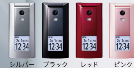
シルバー ブラック レッド ピンク

製造元 京セラ株式会社 〒612-8501 京都市伏見区竹田鳥羽殿町6 http://www.kyocera.co.jp