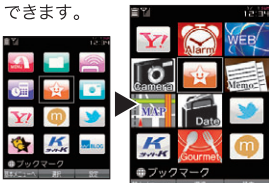
※画面はカスタム例のイメージです。

よく使う機能やお気に入りのコンテンツを登録。さらにデータフォルダに保存した画像などをアイコンにすることもでき、自分が一番使いやすいオリジナルメニューをかんたんに作成できます。