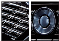
テンキー 円形十字キー

使いやすくて、美しい テンキー&円形十字キー ドーム形状で押しやすい キーボタン。金属感が 大人の質感をさらに 演出します。