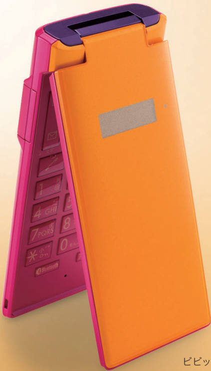
ビビットで華やかな スパイシーオレンジ