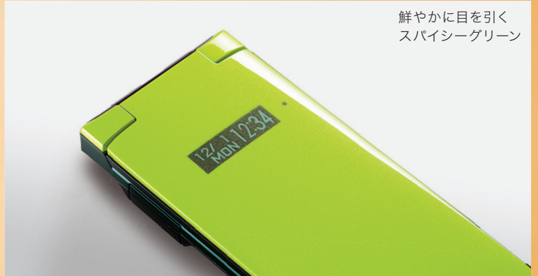
鮮やかに目を引く スパイシーグリーン