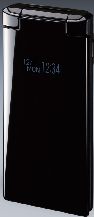
すっきりした シンプルなフォルム