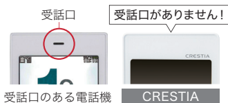
受話口のある電話機