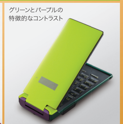
グリーンとパープルの 特徴的なコントラスト