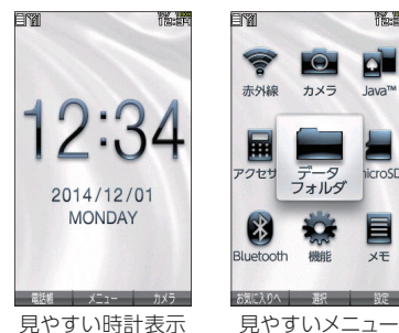
見やすい時計表示

時計やメニューアイコンが大きく見やすい画面表示。選択した項目もわかりやすく表示します。