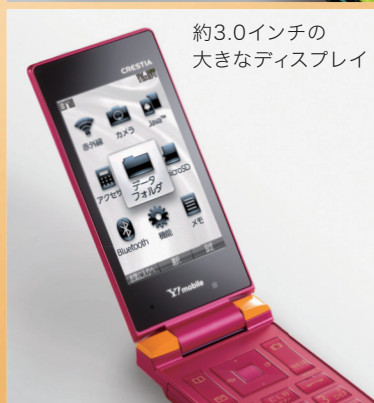
約3.0インチの 大きなディスプレイ