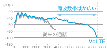
従来の通話とVoLTEによる通話の周波数帯域比較

※VoLTEは、SoftBank 4G LTEエリアにてのみ利用が可能です。高音質での通話はソフトバンクのVoLTE対応端末同士、またはHD Voice対応端末との通話でご利用が可能です。通話中にVoLTE対応端末が3Gエリアに移動した場合、自動的に従来音質の通話(3G回線の通話)へ切り換わり、再度SoftBank 4G LTEエリアに移動しても高音質通話には切り換わりません。