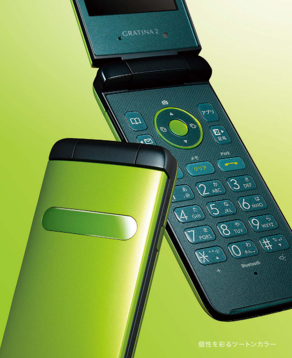
個性を彩るツートンカラー