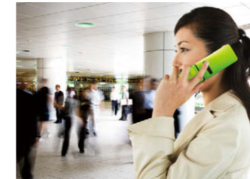
騒がしい場所でも聞き取りやすい

音と振動で相手の声を伝える、京セラの独自機能「スマートソニックレシーバー®」を搭載。耳を覆うようにディスプレイ部に当てると、周りの騒音を遮蔽します。駅のホームやお店の中など、騒がしい場所でも相手の声が聞きやすくなります。