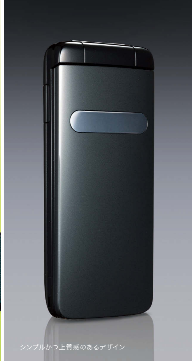
シンプルかつ上質感のあるデザイン