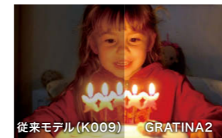
薄暗いシーンも明るくキレイ

高感度センサーの採用で、夜景や室内などの薄暗いシーンも明るくクリアな画質で再現。大切な瞬間をキレイに残せます。