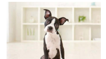
シャッターチャンスを逃さない

画面の中央にピントを合わせ続ける機能で、子どもやペットなどの動きのある被写体でも、撮りたい瞬間にピントの合った写真が撮れます。