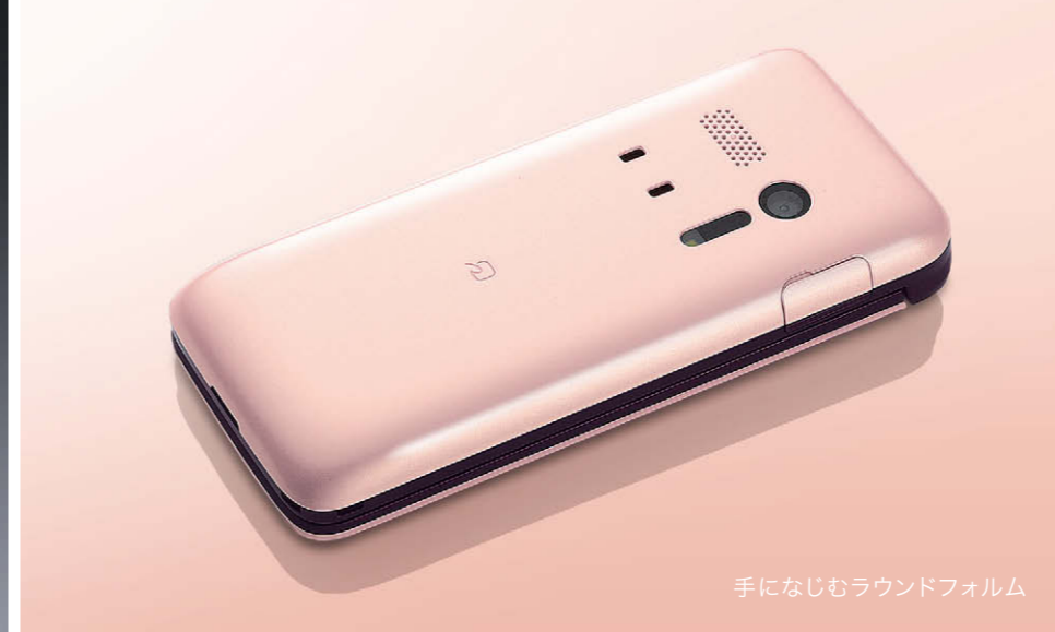
手になじむラウンドフォルム