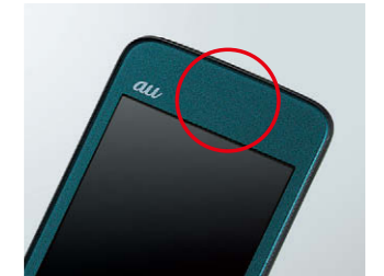
受話口がないためほこりが入る心配もありません