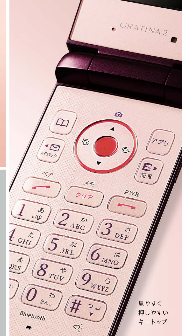
見やすく押しやすいキートップ