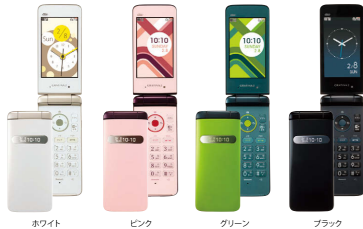
ホワイト ピンク グリーン ブラック

*1 日本国内の3Gエリアにおける静止状態での平均的な利用時間です。実際にご利用になる地域や使用状況などにより短くなります。*2 専用オプション品として別売もしています。