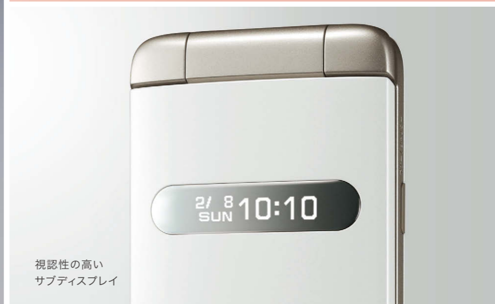
視認性の高いサブディスプレイ