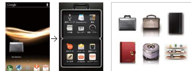
ウィジェットをタップして「My Selection」を起動。タイトルは自由に変更できます。

よく使うアプリをカテゴリー別にまとめて、ホーム画面に配置可能。ビジネスやプライベートなど、シーンによって使うアプリを変えたい方にも便利です。