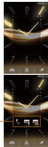
ロックスクリーン