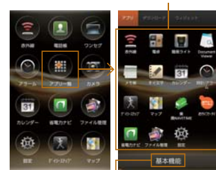
シンプルメニュー シンプルメニューOFF時

ケータイを使い慣れた人のために、3×4のアイコンを配置したシンプルなメニュー画面を採用。設定により、シンプルメニューのON/OFFの設定も可能です。