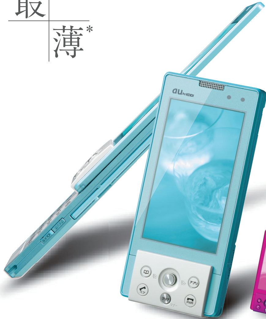
イノセントブルー