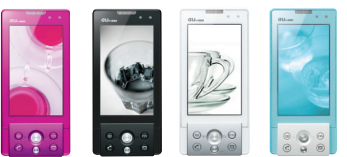
ボヘミアンピンク サイレンスブラック ピースホワイト イノセントブルー