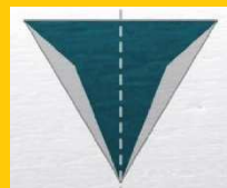
スリムカット逆三角針

スリムカット逆三角針は、スムーズに針を刺し込みやすく、 周囲組織の損傷を最小限に抑える。