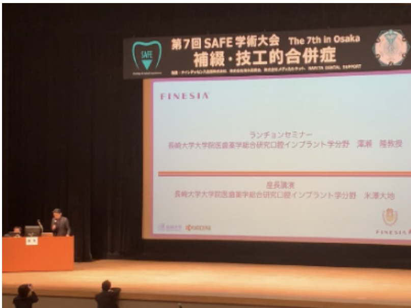
共催ランチョンセミナー