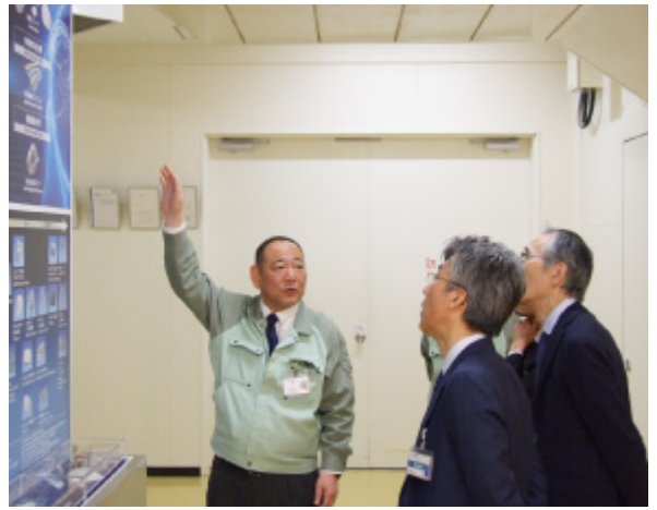
滋賀野洲工場の見学風景