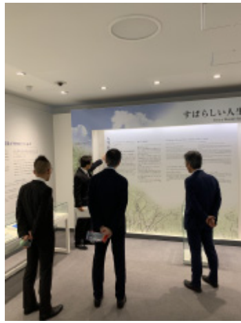
稲盛ライブラリーの見学風景