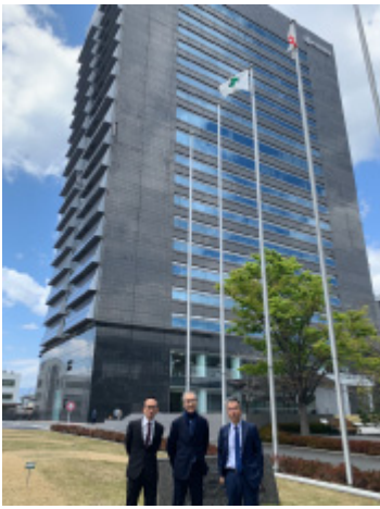
京セラ本社ビル前