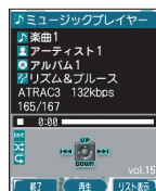
ミュージック プレイヤー画面