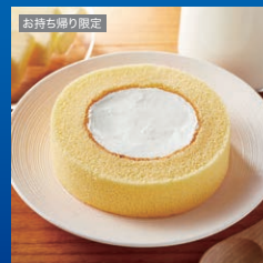
ウチカフェプレミアムロールケーキ

都合により商品が変更になる可能性がございます。 商品受け取り方法は裏面をご覧ください。 スマートフォン以外の端末ではご利用いただけません。