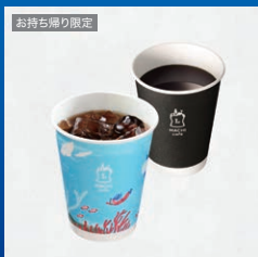
MACHI caféドリンク(S) (1杯)