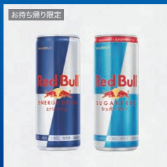
レッドブル 250ml 2種いずれか1つ