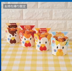
からあげクン 各種いずれか1つ